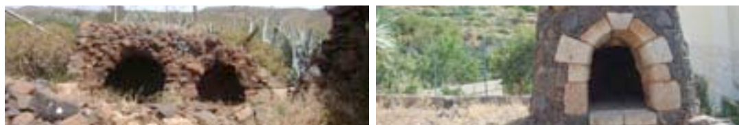
Algunos de los recursos inventariados durante los trabajos realizados en los dos años