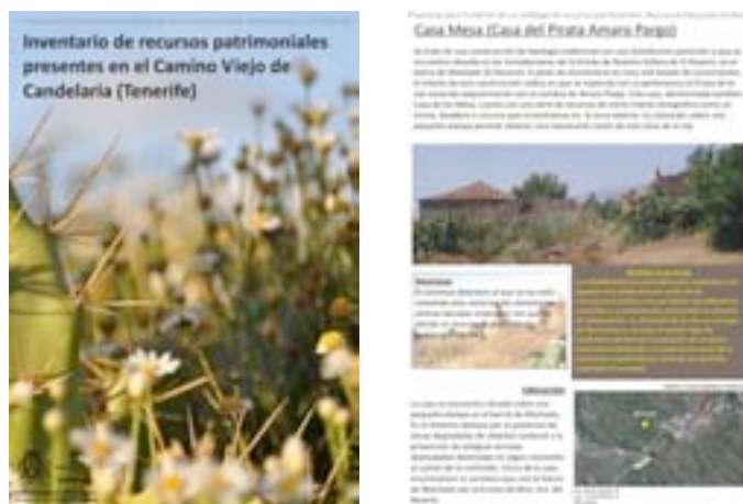
Portada del inventario de recursos y ejemplo de ficha puntual con cartografía y datos

Durante la edición del Campo de Trabajo de 2011, las personas asistentes centraron sus trabajos en la elaboración de un catálogo de recursos de interés presentes en el camino. La intención de estos trabajos era la de contar con información básica sobre los recursos patrimoniales con los que cuenta el Camino Viejo de cara a su conservación y posible promoción. En este catálogo se recoge de modo somero, algunas de las afecciones a las que se enfrentaban estos recursos.