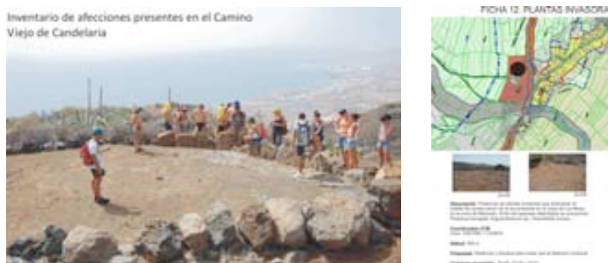
Portada del inventario de afecciones y ejemplo de ficha puntual con cartografía y datos

En la segunda edición del Campo de Trabajo Internacional, las labores se centran en la realización de un inventario de afecciones a lo largo del tramo del Camino Viejo sometido a estudio. De esta manera, y trabajando en los diferentes tramos, se obtiene un catálogo con 70 afecciones de diferente tipo (deterioro, incursión de elementos externos...) Estas afecciones son inventariadas tomando su posición con tecnología GPS y añadidas a una base cartográfica que puede ser de gran utilidad para el desarrollo de futuras intervenciones de recuperación o mejoras en el propio camino.