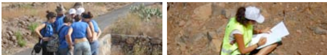
Durante los trabajos de campo recopilando datos en el propio camino